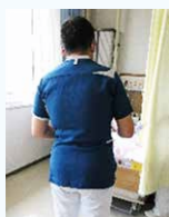
医療安全担当 (病棟ラウンド中)