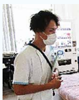
感染管理担当 「次の現場へ！」