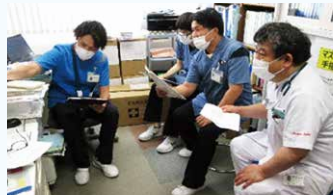
ICT・ASTカンファレンス (多職種担当と意見交換)