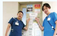
安全安心を届けます！

今回、病院にある様々な部署の中でも特に皆さんにお会いする機会の少ないそれぞれの管理者が、普段の取り組みの一部をご紹介します。