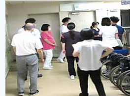
附属老健も感染対策中！

こんにちは！私たちの部署では、常に医療の安全性を高めるために、院内における現行のシステムを見直してより適切な形に作り替えたり、定期的な院内ラウンドを実施したり、職員を対象とした研修を企画・実施したりしています。