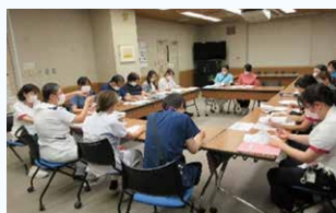
リスクマネジメント部会(毎月開催)