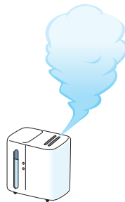
部屋の 適度な湿度

インフルエンザは、主に、咳やくしゃみの際に口から発生する小さな水滴（飛沫）によって感染します（飛沫感染）。普段から“咳エチケット”（①他の人に向けて咳やくしゃみをしない、②咳やくしゃみが出るときはマスクをする、③手のひらで咳やくしゃみを受け止めたら手を洗うことなど）を心がけてください。