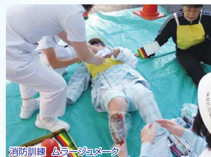
消防訓練 ムラージュメーク