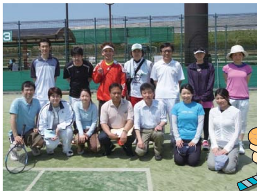
院長も応援にかけつけました。

いろいろな部署の人が集まって練習をしたり試合に臨んだりして普段見ることのできない一面ものぞかせていました。意外な一面を出していることがとても良い雰囲気です。今、医療に臨まれていることは、チーム医療という言葉です。チーム医療と一言に行政も現場も語っていますがつかめずにいます。とても良い参考になるのではないのでしょうか。このような大会が長く続くことを望みます。